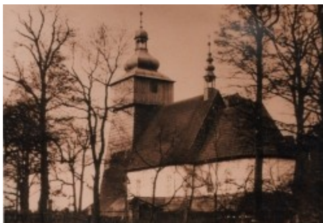
Zdjęcie 5. Stary kościół.

Spłonął on w roku 1957, kiedy obecny nie był jeszcze ukończony. Opóźnienie w budowie nowego kościoła miało miejsce ze względu na kryzys ekonomiczny w latach 30., a następnie II wojnę światową. Do budowy powrócono z wielkimi trudnościami właśnie po wyżej wspomnianym pożarze.