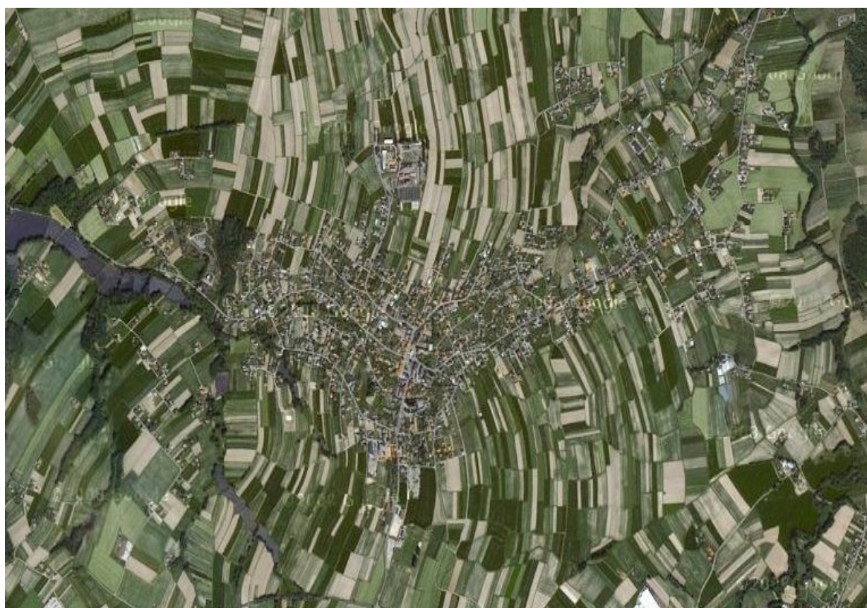
Zdjęcie 1. Wilamowice – zdjęcie satelitarne

Historia Wilamowic sięga XIII wieku. Miał wówczas miejsce najazd Tatarów, w czasie którego wyginęła miejscowa ludność. Książęta śląscy zostali zmuszeni do sprowadzenia osadników z zachodniej Europy. Wraz z nimi, na tereny dzisiejszych Wilamowic, dotarły język i stroje.