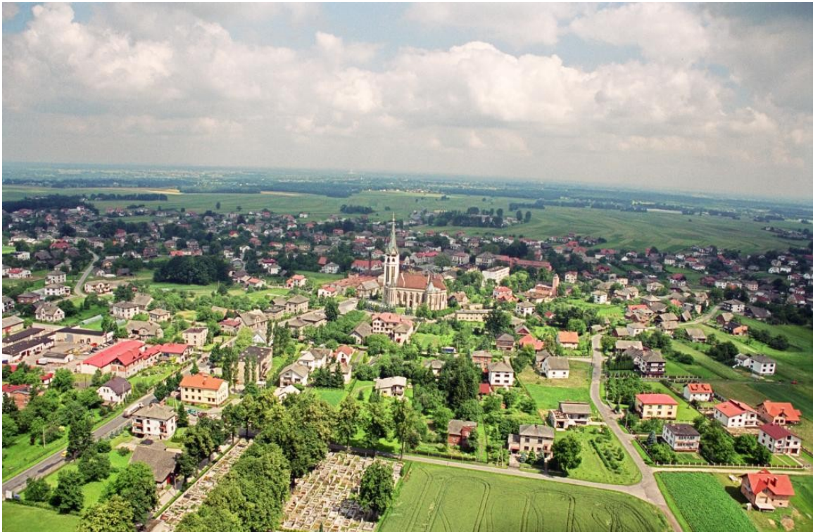
Zdjęcie 2. Wilamowice – zdjęcie lotnicze

W okolicach dominanty przestrzennej, którą jest w przypadku Wilamowic wspomniany wcześniej rynek, usytuowane są takie obiekty, jak budynek Urzędu Gminy, Szkoła Podstawowa i Gimnazjum, Ochronka prowadzona przez siostry zakonne, apteka i punkty handlowe, a w niedalekiej odległości kościół parafialny pod wezwaniem św. Trójcy, a także ośrodek zdrowia oraz bank spółdzielczy. Pół kilometra od rynku w kierunku Bielska-Białej, na wolnej przestrzeni usytuowany jest obiekt LKS-u „Wilamowiczanka”.