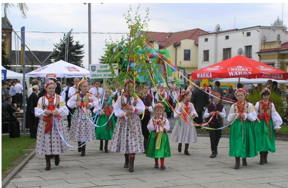
Zdjęcie 8. Zespół „Fil”