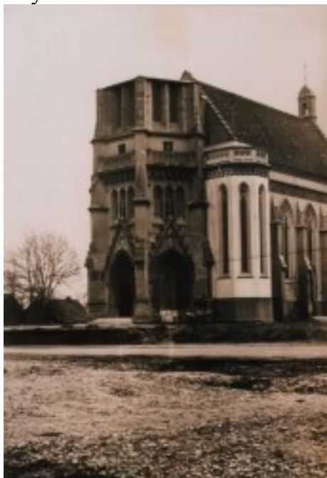
Zdjęcie 6. Nowy kościół bez wieży.

Została ona ukończona w latach 1980 – 1984, kiedy powstał najbardziej niebezpieczny etap budowy – wieża główna o wysokości 72 metrów (łącznie z krzyżem umieszczonym na jej szczycie) i 5 wieżyczek bocznych. W latach 90. świątynia została upiększona okazałym ołtarzem, dwoma ołtarzami bocznymi, drogą krzyżową i innym rzeźbami dzięki talentowi tutejszego samouka-rzeźbiarza, Pana Danka.