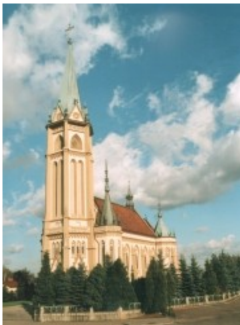
Zdjęcie 4. Kościół parafialny.

Budowę rozpoczęto w roku 1923, natomiast jej inicjatorem był wspomniany już wcześniej św. abp. Józef Bilczewski. Budowę rozpoczęto jeszcze w okresie, kiedy obok obecnej świątyni stał zabytkowy drewniany kościół.