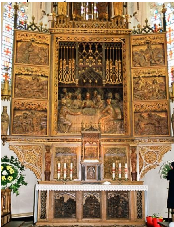
Zdjęcie 7. Ołtarz w kościele parafialnym

Została ona ukończona w latach 1980 – 1984, kiedy powstał najbardziej niebezpieczny etap budowy – wieża główna o wysokości 72 metrów (łącznie z krzyżem umieszczonym na jej szczycie) i 5 wieżyczek bocznych. W latach 90. świątynia została upiększona okazałym ołtarzem, dwoma ołtarzami bocznymi, drogą krzyżową i innym rzeźbami dzięki talentowi tutejszego samouka-rzeźbiarza, Pana Danka.