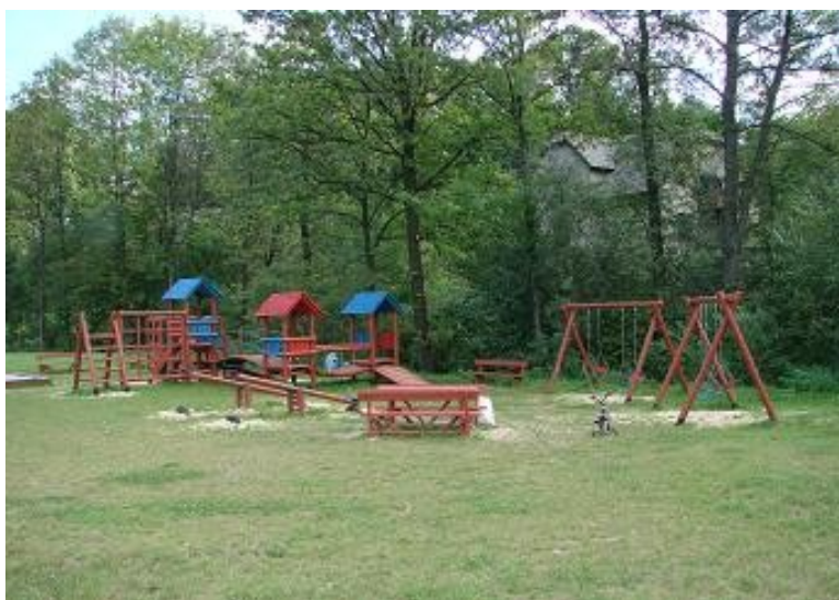
Dziecięcy plac zabaw