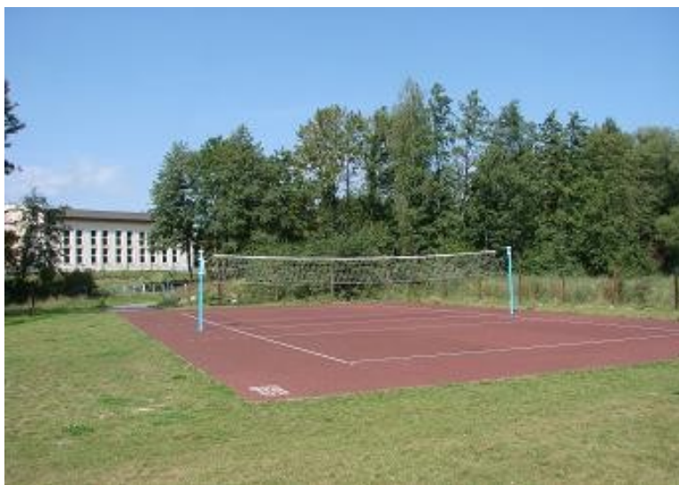
Boisko do siatkówki na tle sali gimnastycznej.

Osobnym przejawem aktywności mieszkańców miejscowości jest udział w imprezach sportowych organizowanych przez Klub Sportowy „Grom”, takich jak krosy rowerowe, turnieje piłki siatkowej czy zawody piłki nożnej. Wykorzystywane są obiekty sportowo-rekreacyjne: sala gimnastyczna przy szkole podstawowej, boiska do piłki nożnej i siatkowej oraz plac zabaw dla dzieci. Wymienione obiekty, wybudowane w ramach inwestycji gminnych w latach 2004-2007, w znaczący sposób wpłynęły na wyniki osiągane przez dzieci i młodzież na międzyszkolnych imprezach sportowych. Wynikiem rozwoju bazy sportowej jest również samorządne powstawanie drużyn amatorskich.