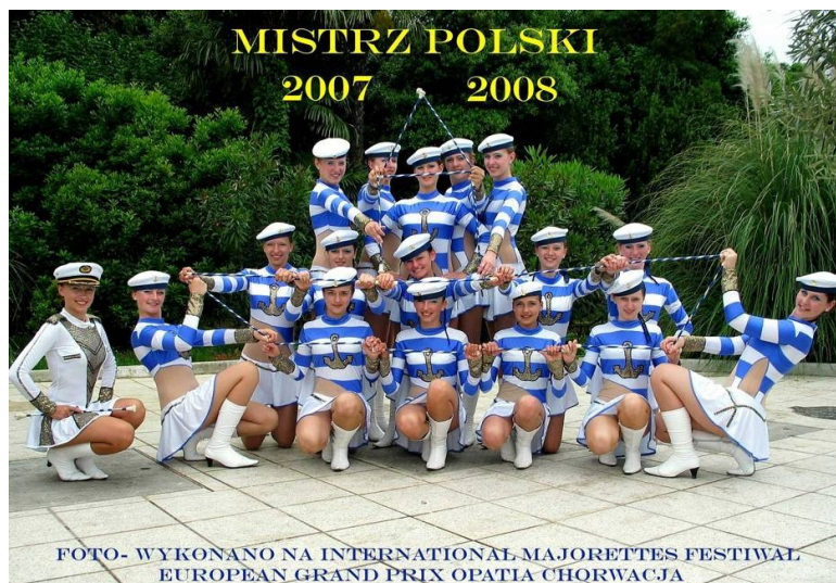
Zespół mażorettek „Gracja”

Wiele z tych organizacji może pochwalić się sporymi osiągnięciami w skali regionu, kraju a także kontynentu. Warto tu wymienić chociażby sukcesy mażorettek w mistrzostwach Polski (I i II miejsca) i Europy (III miejsce), czy ośmiokrotne uczestnictwo Orkiestry Dętej „Starowsianka” w finałach ogólnopolskich przeglądów orkiestr dętych (czterokrotnie w gronie laureatów).