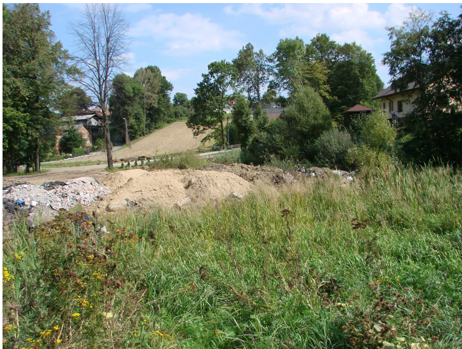
Część Terenów na etapie niwelacji

Pozostałą część stanowią nieużytki, na których gromadzony jest materiał (ziemia) w celu zniwelowania poziomego terenu. Badania hydrogeologiczne przeprowadzone na podstawie materiału pochodzącego z odwiertów wykonanych na omawianym obszarze, potwierdziły jego przydatność pod lokalizację obiektu.