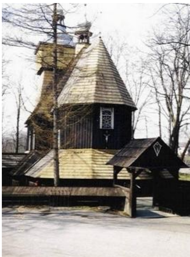
Kościół parafialny z XVI w. pw. Podwyższenia Krzyża św.

Najbardziej wyróżniającym i najcenniejszym dla miejscowości jest, znajdujący się na Szlaku Architektury Drewnianej, kościół parafialny z XVI w. pw. Podwyższenia Krzyża św. (nr rejestru zabytków A-363/78). Wzniesiony w początkach XVI wieku, prawdopodobnie przez Krzysztofa Bibersteina Starowiejskiego, konsekrowany został w 1530 r. Ten znajdujący się na liście UNESCO, kryty gontem zabytek, wyróżnia się pięknym położeniem w centrum wsi, na wysokim wzniesieniu w otoczeniu wiekowych drzew. Specjalistyczne badania przeprowadzone w tej świątyni dowodzą, że elementy prezbiterium datowane są na wiek XIV. Jedyną w swoim rodzaju jest również drewniana podłoga kościoła, która charakteryzuje się dużym nachyleniem (różnica poziomów 1,5m).