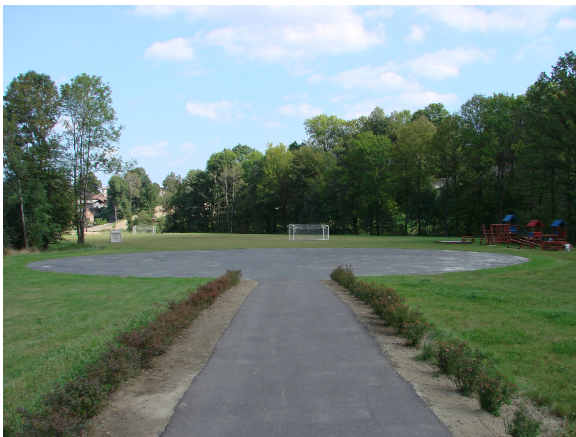
Widok na Tereny Rekreacji i Wypoczynku