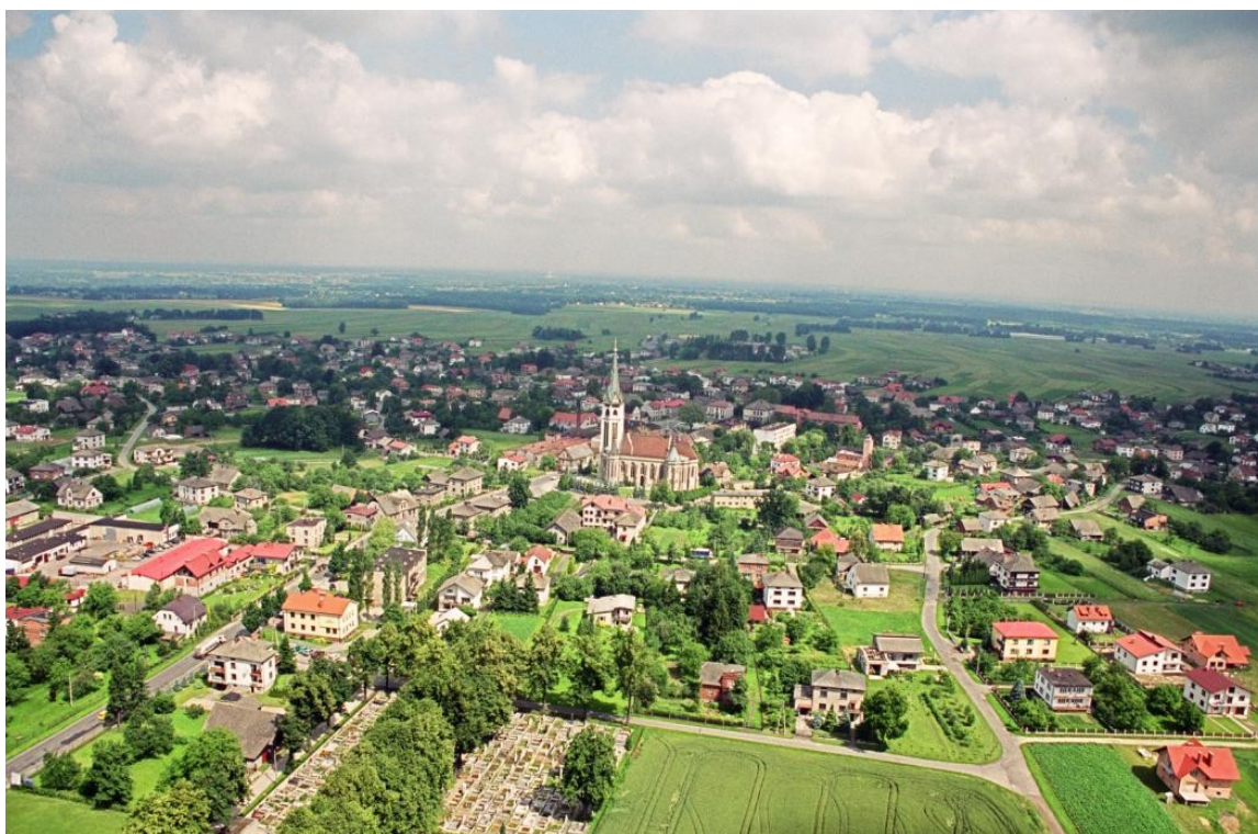
Zdjęcie 2. Wilamowice – zdjęcie lotnicze

W okolicach dominanty przestrzennej, którą jest w przypadku Wilamowic wspomniany wcześniej rynek, usytuowane są takie obiekty, jak budynek Urzędu Gminy, Szkoła Podstawowa i Gimnazjum, Ochronka prowadzona przez siostry zakonne, apteka i punkty handlowe, a w niedalekiej odległości kościół parafialny pod wezwaniem św. Trójcy, a także ośrodek zdrowia oraz bank spółdzielczy. Pół kilometra od rynku w kierunku Bielska-Białej, na wolnej przestrzeni usytuowany jest obiekt LKS-u „Wilamowiczanka”.