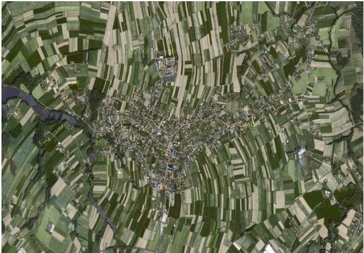
Zdjęcie 1. Wilamowice – zdjęcie satelitarne

Historia Wilamowic sięga XIII wieku. Miał wówczas miejsce najazd Tatarów, w czasie którego wyginęła miejscowa ludność. Książęta śląscy zostali zmuszeni do sprowadzenia osadników z zachodniej Europy. Wraz z nimi, na tereny dzisiejszych Wilamowic, dotarły język i stroje.