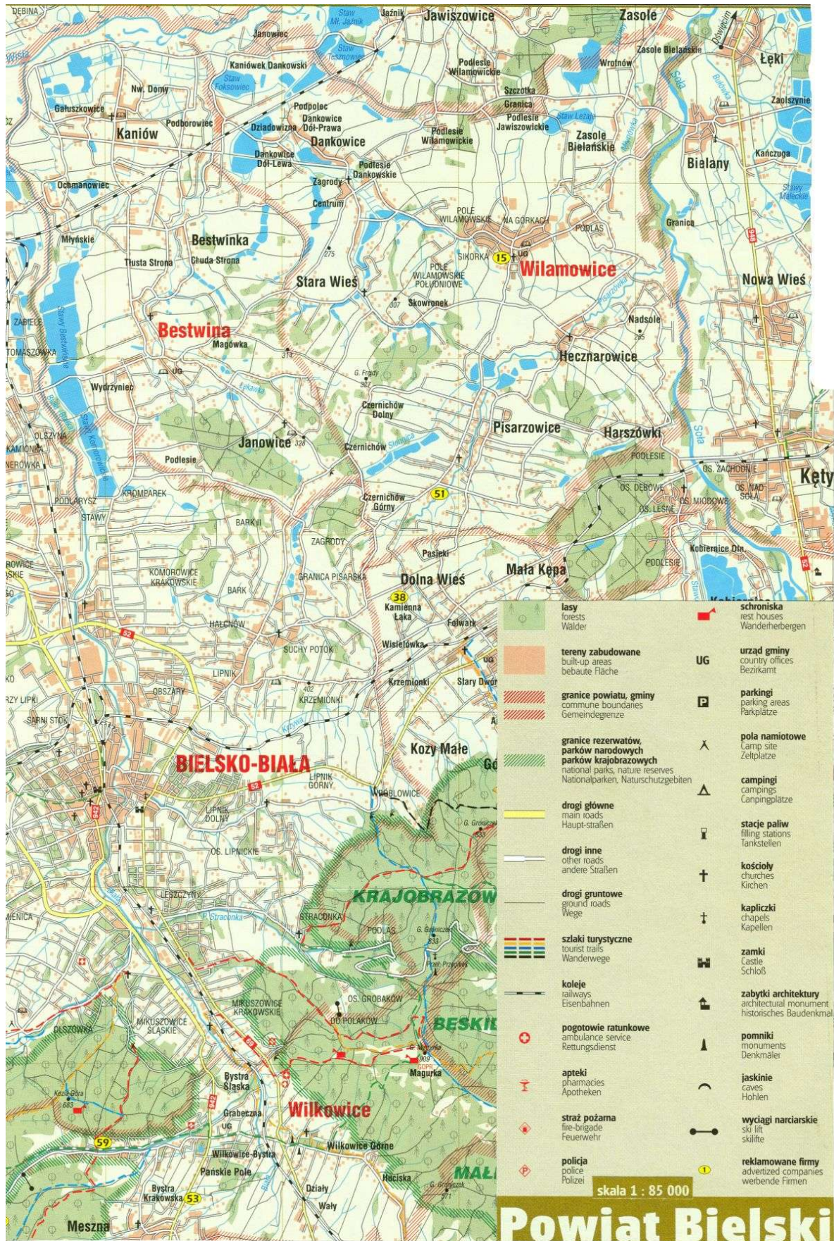
Mapa Gminy Wilamowice